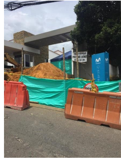
ALTOS DEL CACIQUE