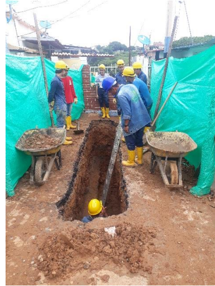
ALFONSO LOPEZ CALLE 4ª ENTRE 6ª Y 7