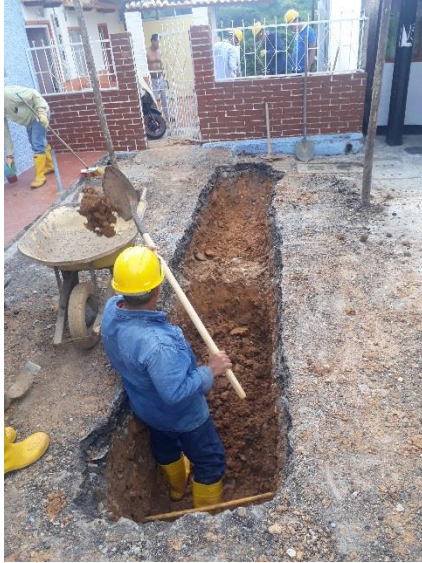
CAMPOHERMOSO CRA 4W CON CALLE 43