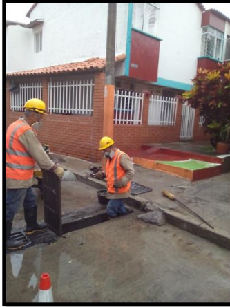
LIMPIEZA BARRIO MANZANARES