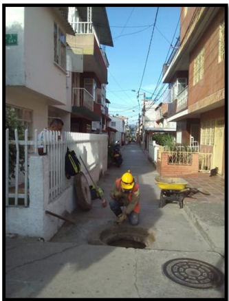
LIMPIEZA BARRIO LOS HEROES