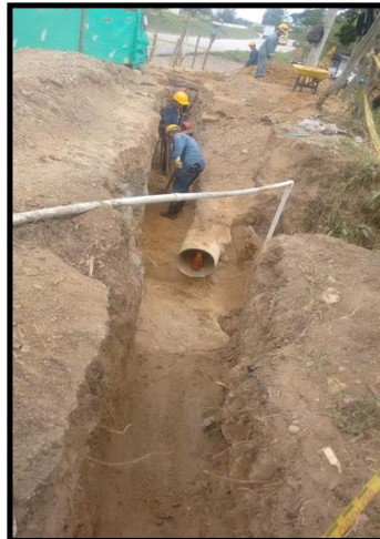
REPARACION BARRIO EL PORTAL DE LOS ANGELES-COLORADOS