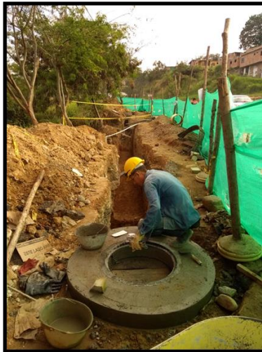
REPARACION BARRIO EL PORTAL DE LOS ANGELES-COLORADOS