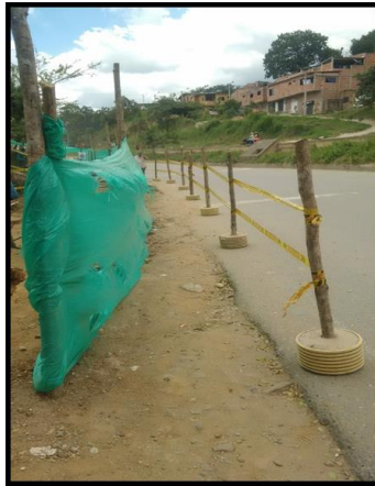
REPARACION BARRIO EL PORTAL DE LOS ANGELES-COLORADOS