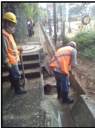
LIMPIEZA BARRIO MUTIS