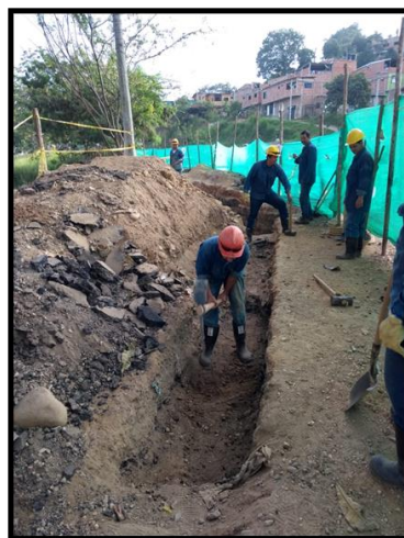
REPARACION BARRIO EL PORTAL DE LOS ANGELES-COLORADOS