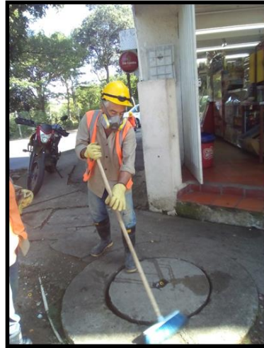
LIMPIEZA BARRIO PLAZUELA REAL