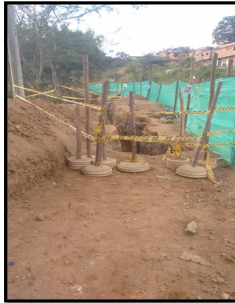
REPARACION BARRIO EL PORTAL DE LOS ANGELES-COLORADOS