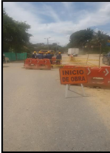
REPARACION BARRIO EL PORTAL DE LOS ANGELES-COLORADOS