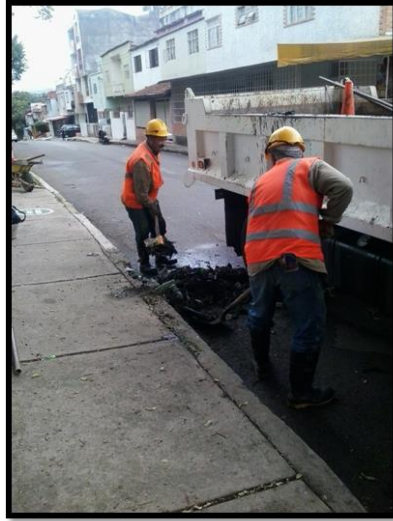
LIMPIEZA BARRIO QUINTA ESTRELLA